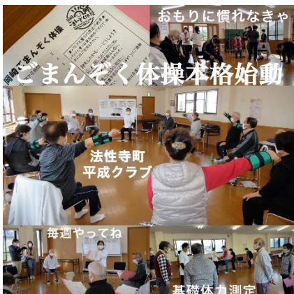
ごまんぞく体操本格始動