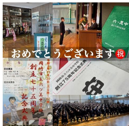
おめでとうございます祝