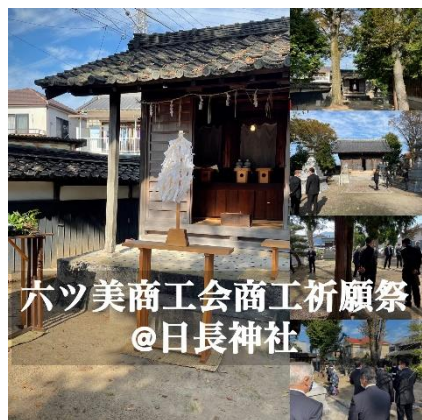
六ツ美商工会商工祈願祭 @日長神社